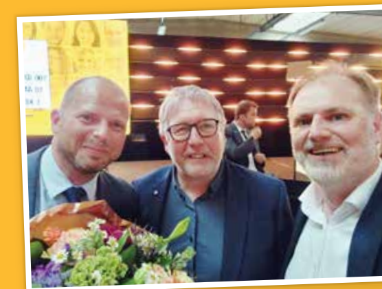
N-VA Kortenberg was uiteraard vertegenwoordigd op het grote ledencongres van de N-VA