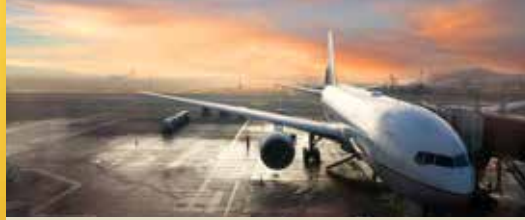
Een evenwichtige visie voor de luchthaven (p. 2)