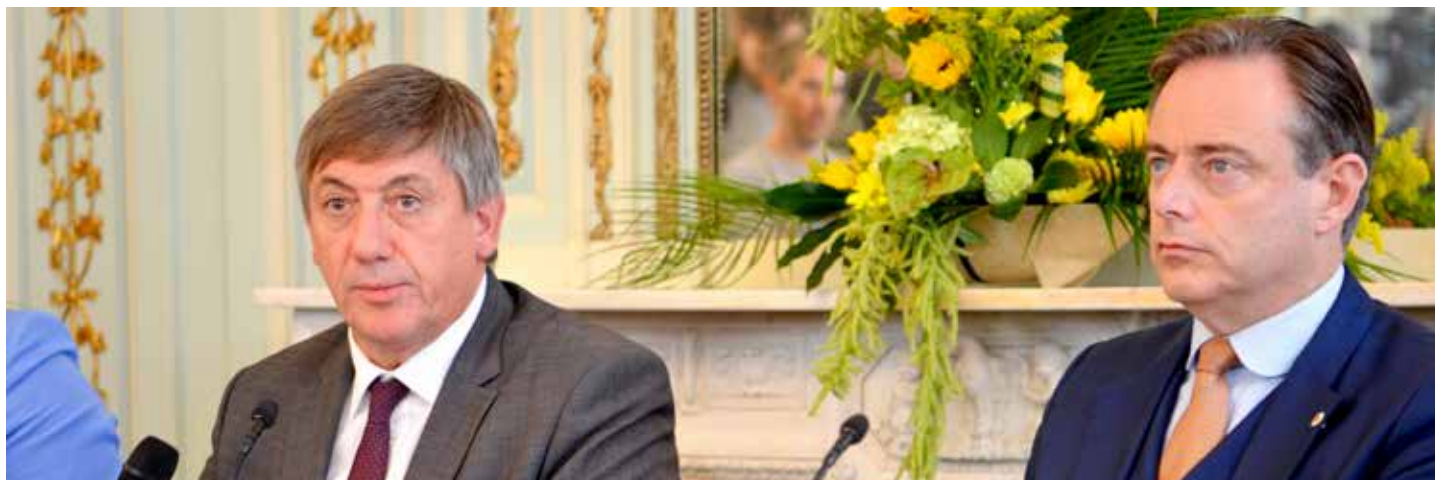
▲ Kersvers minister-president Jan Jambon stelt in het bijzijn van partijvoorzitter Bart De Wever het Vlaamse regeerakkoord voor aan de pers.