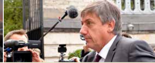
Ook Kortenberg rekent op Vlaanderen (p. 3)